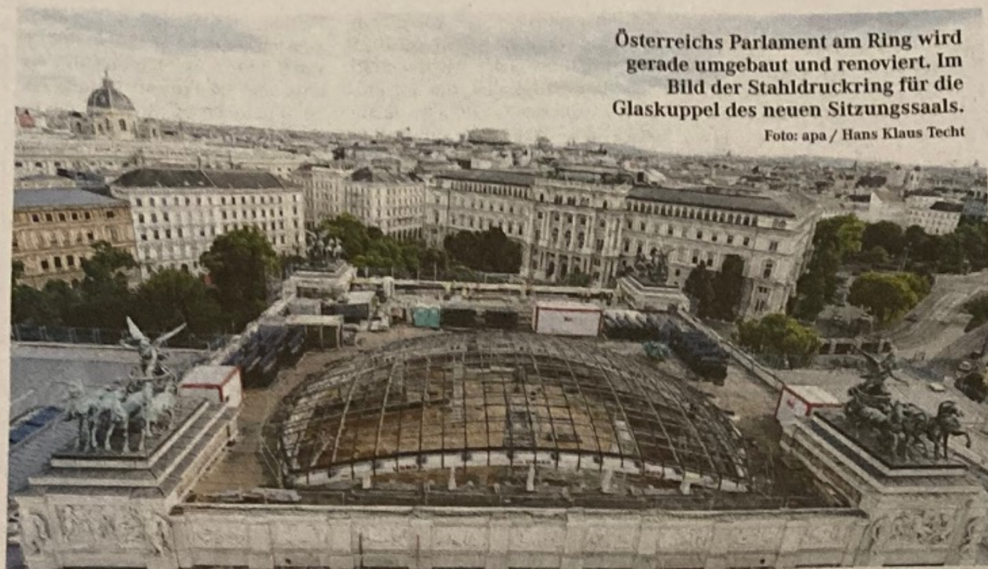
Österreichs Parlament am Ring wird gerade umgebaut und renoviert. Im Bild der Stahlring für die Glaskuppel des neuen Sitzungssaals.

Welan war Hochschulprofessor für öffentliches Recht. Diem, als „Symbolforscher“ apostrophiert, ist von seiner akademischen Herkunft Jurist und Politikwissenschaftler und war lange Zeit für den ORF als Medienforscher erfolgreich unterwegs. Welan setzt sich seit Jahrzehnten mit der österreichischen Bundesverfassung und dem Bundespräsidenten in einer Vielzahl von systematischen politikwissenschaftlichen Publikationen auseinander. Er selbst stellt sich im Buch unkonventionell so vor, dass durch die jahrzehntelange Befassung mit der Verfassung „man so seine Erfahrungen hat, nicht nur gerade, sondern auch schräge Gedanken“;